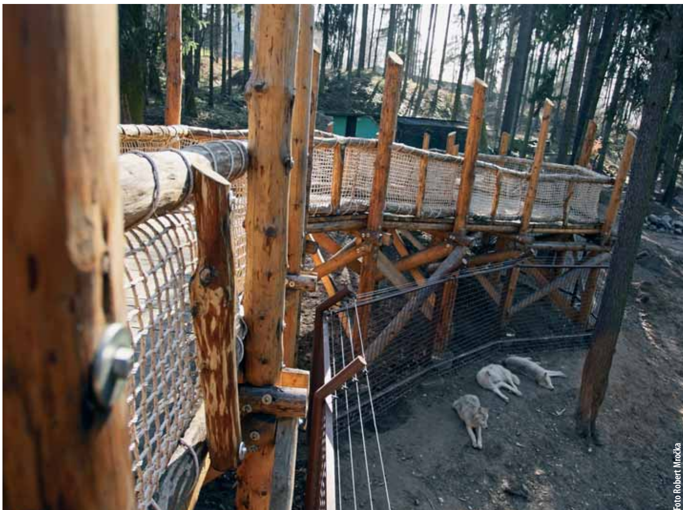
Vlci v novém výběhu, který budou sdílet společně s medvědy.

Domov stovek druhů zvířat na Svatém Kopečku je také členem několika odborných sdružení, například Evropské (EAZA) a Světové asociace zoologických zahrad a akvárií (WAZA). „V Evropě jsme vnímáni jako kvalitní zoologická zahrada,“ pou-