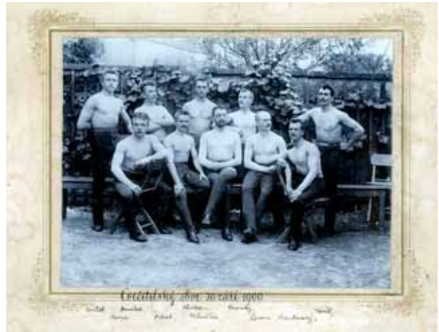
Mužský cvičitelský sbor olomoucké jednoty v roce 1900.

Dnes, po dvaceti letech obnovené činnosti, můžeme říci, že těm, kteří za tu dobu jednotu vedli, resp. ji v poslední době vedou, se hodně podařilo. Ovšem počtem členů i rozsahem aktivit jednota zdaleka nedosahuje té výše, kterou měla před únorem 1948. Má dnes 327 členů, dospělých a mládeže a několik velmi aktivních a v soutěžích úspěšných sportovních oddílů, jako je oddíl skoků na trampolíně, oddíl zápasu, oddíl teamgym. Velmi záslužnou činností je cvičení rodičů s dětmi, tj. s dětmi předškolního věku, a cvičení zdravotní se staršími věkovými kategoriemi.