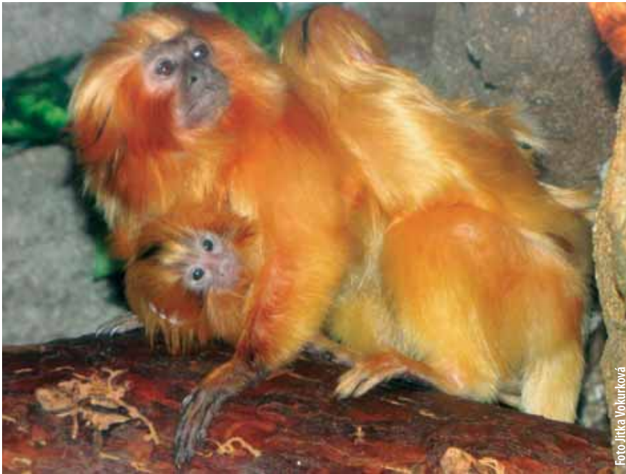
Mládě vzácného Lvička zlatého.

velkého zájmu motoristů jsme schopni operativně rozšiřovat parkoviště i na sousední louku. Ta ovšem nepatří nám, ale pozemkovému fondu," dodává ředitel.