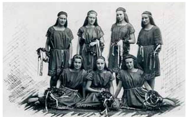
Ženy při sokolské akademii 28. října 1920.