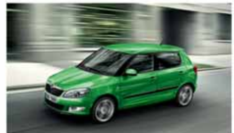
Kombinovaná spotřeba a emise CO 2 modelu Fabia: 4,2-5,9 l/100 km, 109-139 g/km

Při manévrování s vozem na omezeném prostoru oceníte parkovací senzory, které hlídají vzdálenost zadního nárazníku od případné překážky.