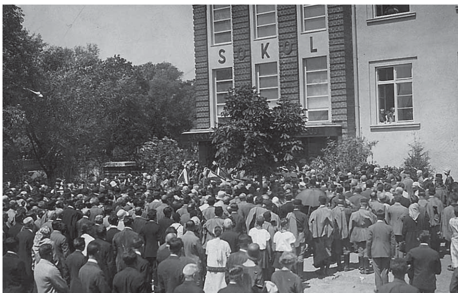
Otevření sokolovny v červenci roku 1928.

Jména Miroslav Tyrš a Jindřich Fügner jistě patří k těm jménům, jež z novodobé české historie jsou, aspoň střední generaci, určitě pak generaci starší, poměrně známá. Jsou spojena se vznikem organizace, která pěstováním tělesné zdatnosti a rozvíjením mravních zásad v českém vlasteneckém duchu chtěla přispět k dovršení národního uvědomění a k získání odpovídajícího postavení českých zemí a českého národa žijícího v 19. století v Rakousku, resp. Rakousko-Uhersku. Tato organizace, nazvaná Sokol podle pojmenování srbských bojovníků za svobodu, se zrodila na začátku roku 1862 v Praze. Po založení první sokolské tělocvičné jednoty následovalo brzy zakládání jednot v dalších městech Čech, Moravy a Slezska, ale i v zahraničí, a to tam, kde žila početnější česká kolonie. Například ve Vídni, v Paříži, v USA a jinde.