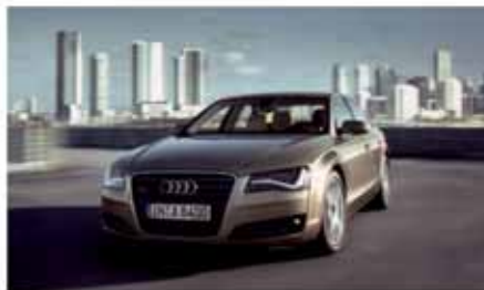
Kombinovaná spotřeba a emise CO 2 modelu: Audi A8 3.0 TDI - 6,0 l/100 km, 159 g/km Audi A8 4.2 FSI: 9,5 l/100 km a 219 g/km Audi A8 4.2 TDI: 7,6 l/100 km a 199 g/km

převodovka tiptronic s velmi komfortním řazením. Trvalý pohon všech kol quattro, se vyznačuje sportovní charakteristikou. V elegantním interiéru, jehož pečlivé zpracování je na úrovni manufakturní výroby, má řidič k dispozici zdokonalený ovládací systém MMI, s navigačním systémem MMI touch. Pro zvýšení bezpečnosti je vůz vybaven novým bezpečnostním systémem Audi pre sense pro odvrácení nehody, resp. minimalizaci jejích následků. Na přání světlomety LED pro veškeré osvětlovací funkce. Audi A8 a informační, zábavní a asistenční systémy - nejnovější generace navigačního systému úzce spolupracuje s asistenčními systémy; highendové audiosystémy a internetové služby, dále je vybaveno asistentem nočního vidění s označováním osob, adaptivní tempomat ACC s funkcí Stop&Go . Podvozek nové Audi A8 - lehká konstrukce závěsů kol, vyvážené rozložení hmotnosti mezi nápravy, vybaven systémem jízdní dynamiky Audi drive select včetně vzduchového odpružení adaptive air suspension a adaptivního tlumení.